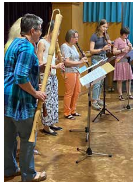
Auftakt mit einer musikalischen Reise des Flötenkreises